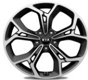
Cerchi in lega 19" GT Line 245/45R19