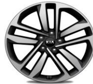
Cerchi in lega 19" 245/45R19