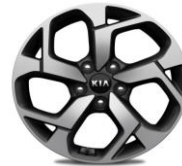
Cerchi in lega 17" 225/60R17